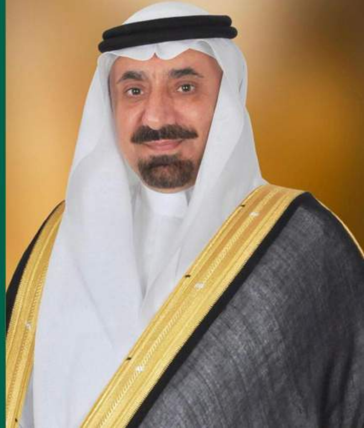
صاحب السمو الملكي الأمير جلوحي بن عبدالعزيز بن مساعد - حفظه الله - أمير منطقة نجران