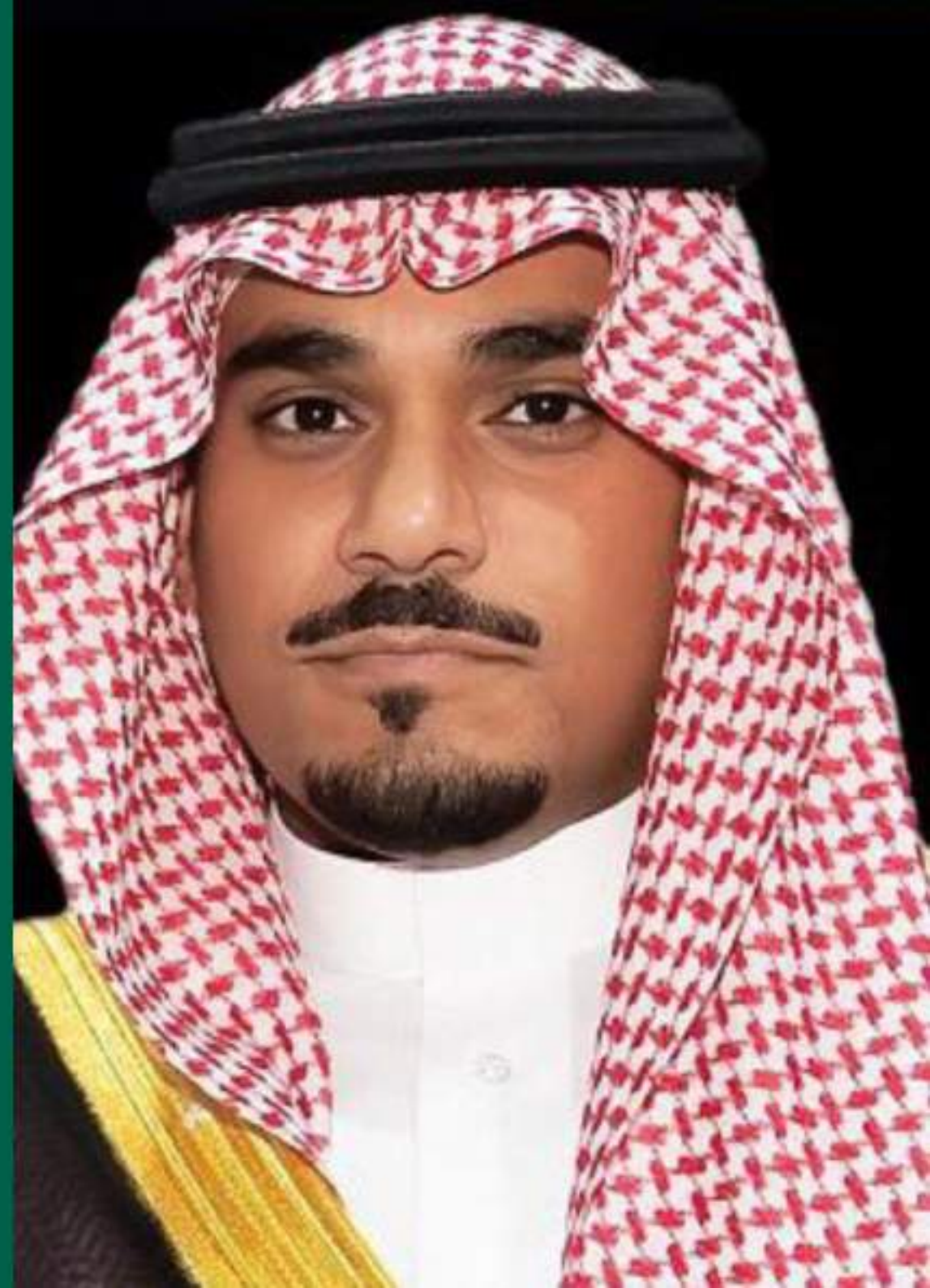
صاحب السمو الملكي الأمير تركي بن هذلول بن عبدالعزيز - حفظه الله - نائب أمير منطقة نجران